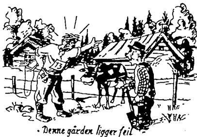
• Denne gården ligger feil •